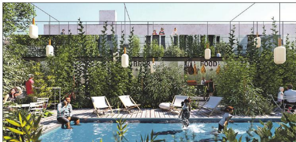
Manifesto na Smíchově chystá i zelenou oázu s vodou.

Manifesto Market, který funguje v sousedství Masarykova nádraží, se chystá oživit další pozapomenuté místo, tentokrát v srdci Smíchova. Druhý dočasný market otevře v létě na prázdném provizorním parkovišti vedle Národního domu na Smíchově. Nepůjde o kopii kontejnerového konceptu z Florence – chystá se zelená oáza s vodní hladinou a originálním výběrem gastronomie.